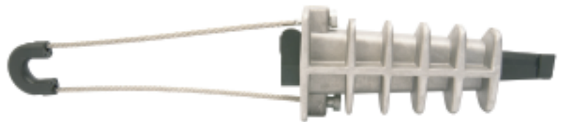
MODELO PAL 1500